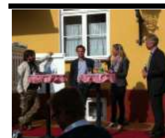
Debat i Klostergårdens have