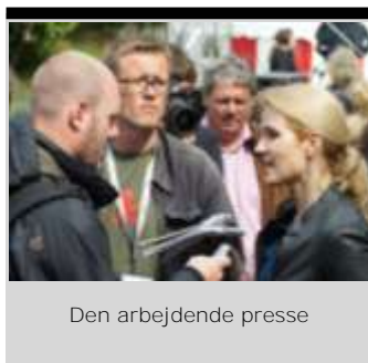
Den arbejdende presse