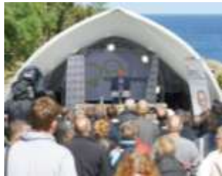
Billede af Danchells talerstol

Fra sydligste mødested til det nordligste var der ca. 1,2 km.