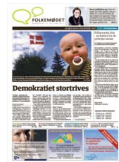
Forsiden af programavisen.

Den var på 36 sider og udkom 7. juni 2011.