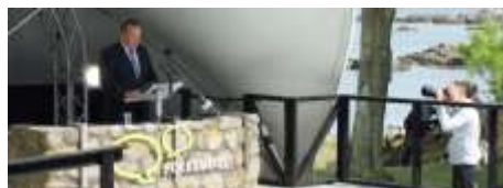
Statsminister Lars Løkke Rasmussen