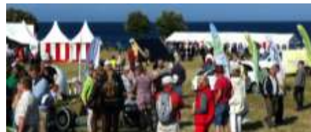
Panoramabillede af tilhørerskare

til hovedscenen. TV2 stod for lyset. BRK havde værtsfunktion og gav pedelhjælp her og i cirkusteltet.