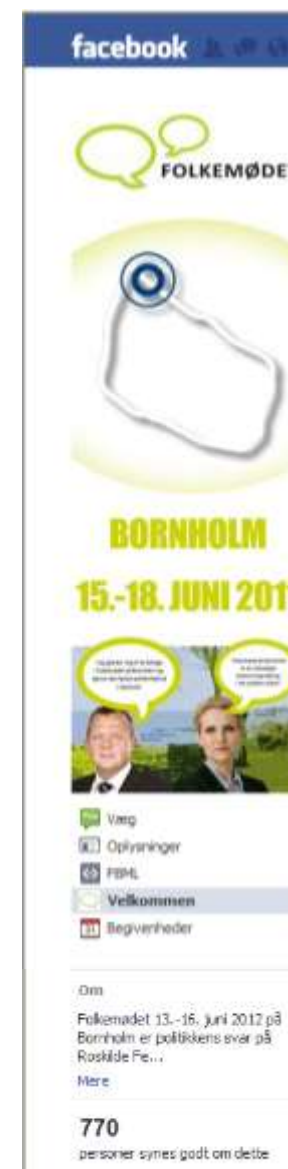
Folkemødet benyttede også Facebook i markedsføringen