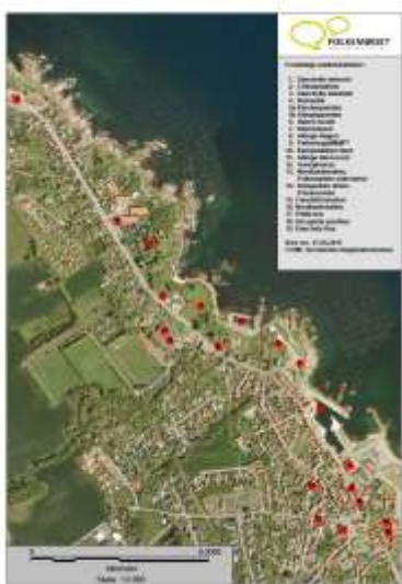
Kort over Folkemødets mødelokaliteter

Fra sydligste mødested til det nordligste var der ca. 1,2 km.