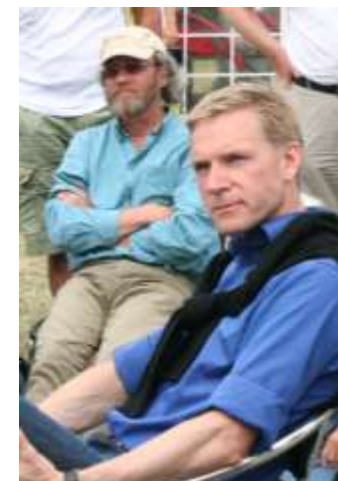
En politiker som tilhører; Kristian Thulesen Dahl overværer seminar

Dog er det først blevet det nationale samlingspunkt som det er nu, i løbet af de seneste 10 år. På Almedalsveckan er "folket" ikke den primære målgruppe, og "folket" udgør ikke en stor procentdel af tilhørerne.