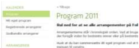
Billede fra programmet på Folkemødet.dk