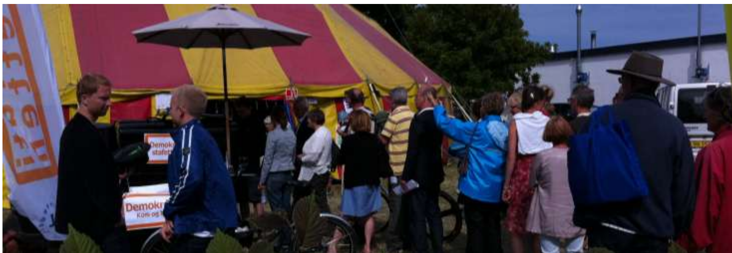
Kø til KLS demokrati-stafet- kaffebod foran Danchells Debattelt