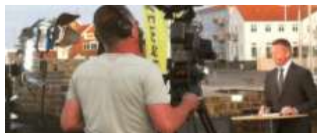
Foto af TV-avisen live på Allinge Havn onsdag den 15. juni 2011.

Pressedækning: Der blev sendt pressemeddelelser ud til lokale og nationale medier og taget kontakt med enkelte medier ift. at sikre om-